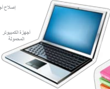
أجهزة الكمبيوتر المحمولة