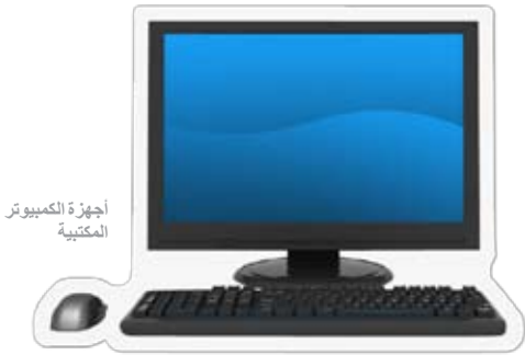
أجهزة الكمبيوتر المكتبية

تساعدك الحكومة الأسترالية في تكاليف تعليم أطفالك.