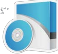
برامج الكمبيوتر التعليمية