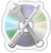
إصلاح أجهزة الكمبيوتر