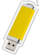
أجهزة فلاش USB ناقلة البيانات الكمبيوترية