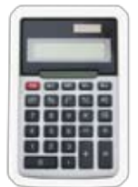
المواد المرتبطة بالتعلم