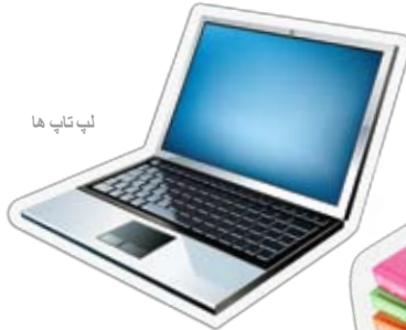
لپ تاپ ها