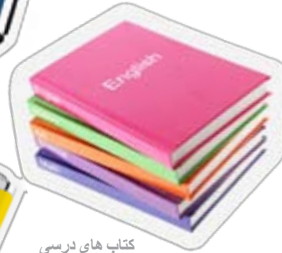
کتاب های درسی