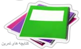
کتابچه های تمرین