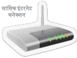
मासिक इंटरनेट कनेक्शन

प्राथमिक विद्यालय में पढ़ने वाले हरेक बच्चे के लिए अधिकतम $397 और माध्यमिक विद्यालय के हरेक बच्चे के लिए अधिकतम $794 की धनराशि वापिस मिल सकती है।