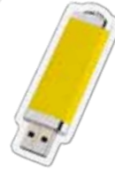
यू एस बी फ्लैश ड्राइव