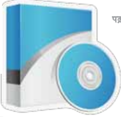
पढ़ाई के लिए सॉफ्टवेयर