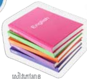
រៀនកៅអាន