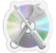
ថ្លៃចំណាយលើការជួសជុលខុមព្យូធើរ