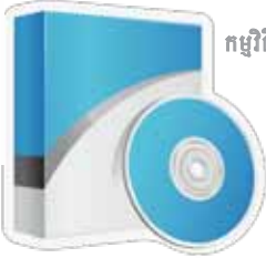
កម្មវិធីខុមព្យូធើរសំរាប់ការសិក្សា