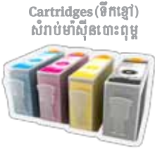
Cartridges (ទឹកខ្មៅ) សំរាប់ម៉ាស៊ីនចោះពុម្ព