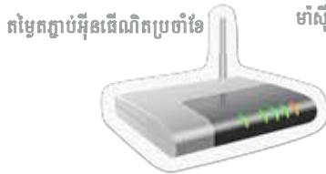
តម្លៃតភ្ជាប់អ៊ីនធឺណិតប្រចាំខែ

ប្រាក់ពន្ធដារដែលទទួលបានមកវិញអាចមានរហូតដល់ទៅ $397 សំរាប់កូនម្នាក់ៗរៀននៅសាលាបឋមសិក្សា ហើយរហូតដល់ទៅ $794 សំរាប់កូនម្នាក់ៗរៀននៅសាលាមធ្យមសិក្សា។