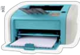
ម៉ាស៊ីនចោះពុម្ព