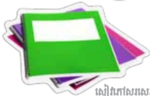
រៀនកៅសរសេរ