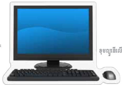
ខុមព្យូធើរលើតុ

រដ្ឋាភិបាលអូស្ត្រាលីកំពុងជួយលោកអ្នក ចំពោះការចំណាយក្នុងការអប់រំរបស់កូនលោកអ្នក។