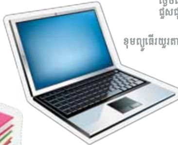
ខុមព្យូធើរយូរតាមខ្លួន