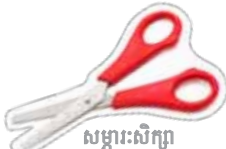
សម្ភារៈសិក្សា

Education Tax Refund Claim everything you are entitled to