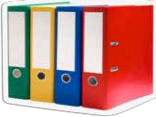
សម្ភារៈសិក្សាជាទម្រង់ក្រដាស