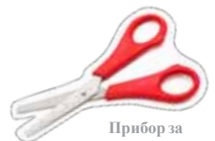
Прибор за писање