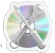
Оправљање кварова на компјутеру