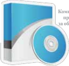
Компјутерски програми за образовање