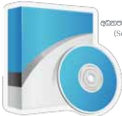
අධ්‍යාපනික මෘදුකාංග (Software)