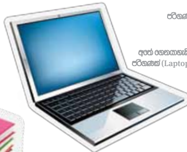
අත් තෙතකැනි ඒරිසෙන්ක් (Laptops)