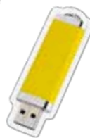
Memorias flash USB