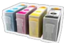
Cartuchos de tinta para impresoras