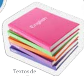
Textos de estudios