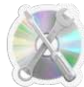
Reparaciones del computador