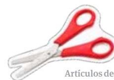
Artículos de escritorio