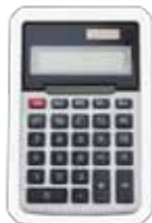
Kaugnay na mga Materyales sa Pag-aaral