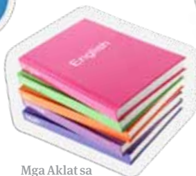
Mga Aklat sa Paaralan