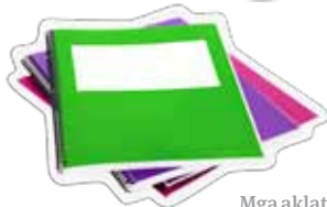
Mga aklat ng pagsasanay