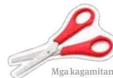
Mga kagamitan sa pagsulat