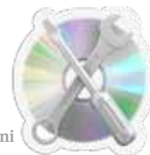
Mga Pagpapakumpuni ng Kompyuter