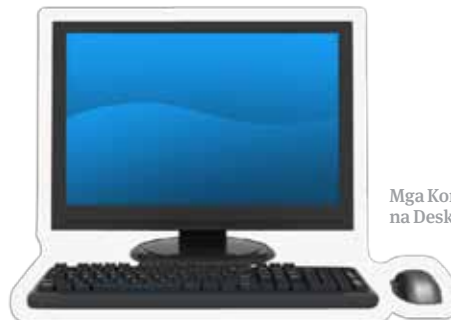
Mga Kompyuter na Desktop

Ang Pamahalaan ng Australya ay tumutulong sa inyong mga gastusin sa pagpapaaral ng inyong mga anak.