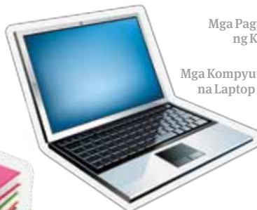
Mga Kompyuter na Laptop