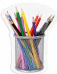
Mga kagamitan sa pagsulat

Magugulat kayo sa maaari ninyong mahingi