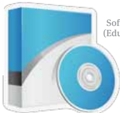
Software sa Pag-aaral (Educational Software)