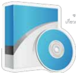
ซอฟต์แวร์ เกี่ยวกับการศึกษา