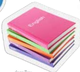
ตำราเรียน