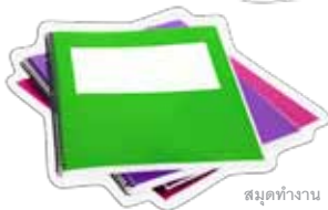
สมุดทำงาน