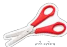
เครื่องเขียน