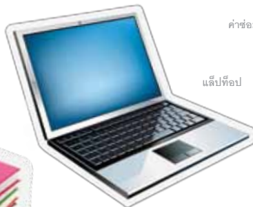
แล็ปท็อป