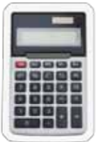
İlgili Öğrenme Gereçleri