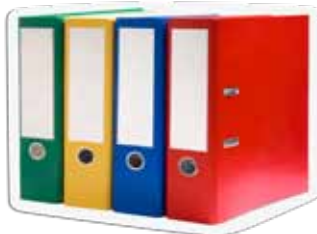
Các Tài Liệu Học Tập Bản In