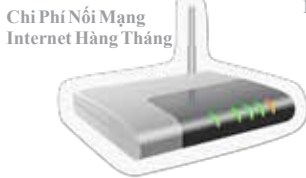
Chi Phí Nối Mạng Internet Hàng Tháng

Các khoản bồi hoàn có thể lên tới $397 cho mỗi học sinh tiểu học và tới $794 cho mỗi học sinh trung học.