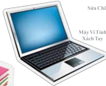
Máy Vi Tính Xách Tay