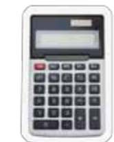
Các Tài Liệu Học Tập Có Liên Quan