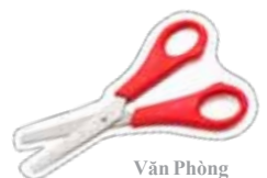
Văn Phòng Phẩm