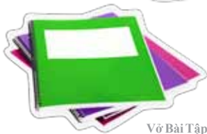
Vở Bài Tập