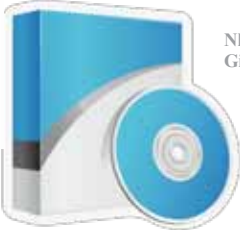
Nhu Liệu Giáo Dục