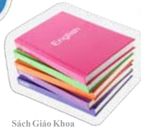
Sách Giáo Khoa