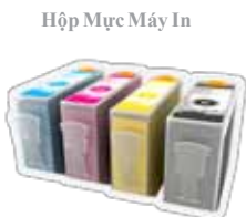
Hộp Mực Máy In