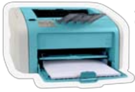
دستگاه های چاپ (Printers)

اکنون شامل های یونیفورم مدرسه خریداری شده از 1 جنوری 2011 می شود