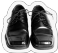
کفش های مورد استفاده در مکتب