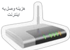
هزینه وصل به اینترنت