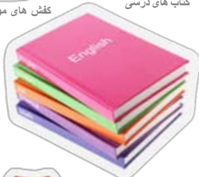
کتاب های درسی