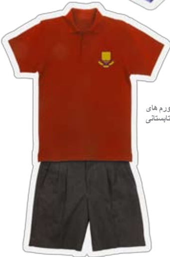
یونیفورم های تابستانی