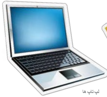
لپ تاپ ها