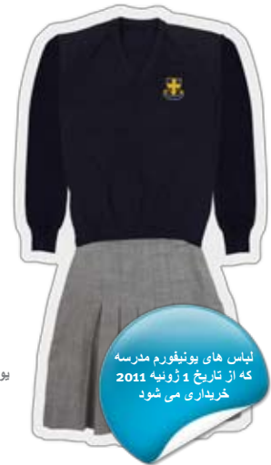
لباس های یونیفورم مدرسه که از تاریخ 1 ژوئیه 2011 خریداری می شود