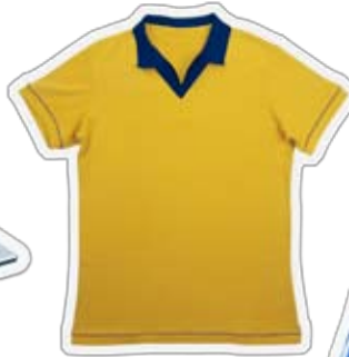
یونیفورم های ورزشی