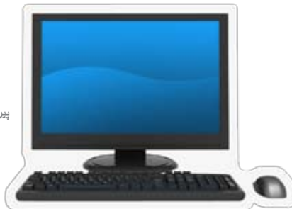
کمپیوتر روی میزی (Desktop Computers)