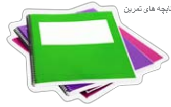
کتابچه های تمرین