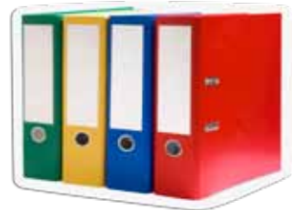
Käk awerek piöc cï looi