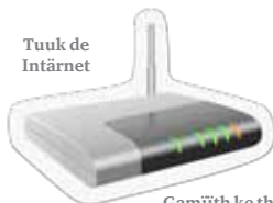
Tuuk de Intärnet