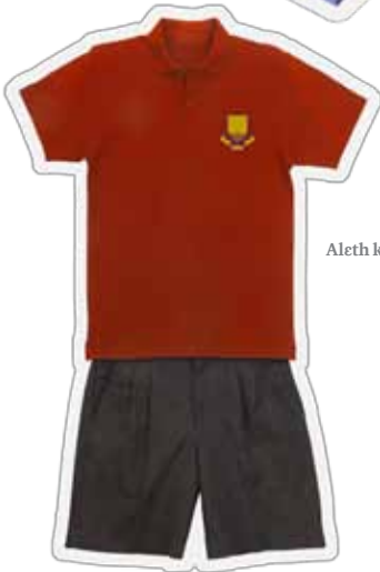
Aleth ke mëi