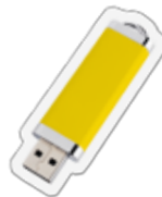
Yuethbï ke täu wël

Akuma ɣothralia yen akuny ë cuet piny de wëu ë piöc mïthku.