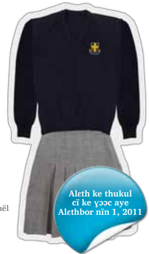
Aleth ke ruël

Aleth ke thukul cï ke ɣəc aye Alethbor nïn 1, 2011