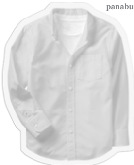
Gamïith ke thukul/ panabun