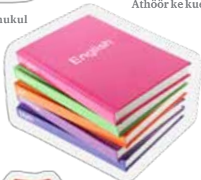
Athöör ke kuen