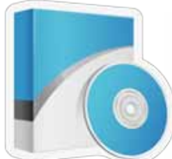
Sopwëër ke piöc