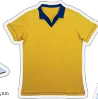
Aleth ke thuëc