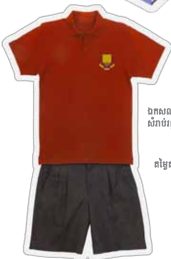
ឯកសណ្ឋានសំរាប់រដូវក្ដៅ