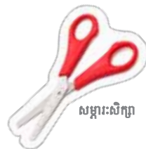
សម្ភារៈសិក្សា