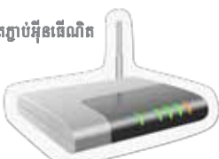
តម្លៃតភ្ជាប់អ៊ីនធឺណិត