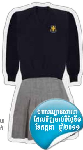
ឯកសណ្ឋានសាលាដែលទិញចាប់ពីថ្ងៃទី១ ខែកក្កដា ឆ្នាំ២០១១