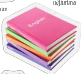
សៀវភៅអាន