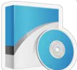
កម្មវិធីខុមព្យូធើរសំរាប់ការសិក្សា