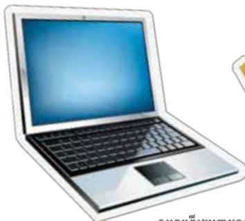
ខុមព្យូធើរចូរតាមខ្លួន