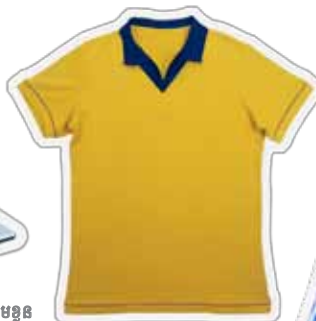
ឯកសណ្ឋានកីឡា