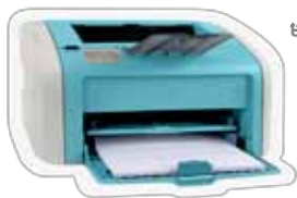
ម៉ាស៊ីនបោះពុម្ព

ឥឡូវនេះមានរួមទាំងឯកសណ្ឋានសាលា ដែលទិញចាប់ពីថ្ងៃទី១ ខែកក្កដា ឆ្នាំ២០១១