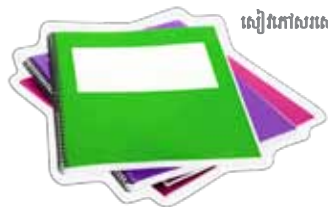
សៀវភៅសរសេរ