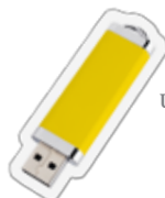
USB 플래시 드라이브