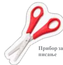
Прибор за писање