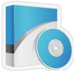
Компјутерски програми за образовање