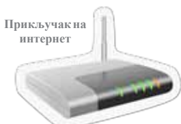
Прикључак на интернет