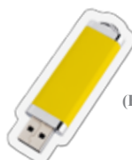
USB флеш (Flash Drives)

Аустралијска влада вам помаже око трошкова образовања ваше деце.