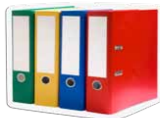
Одштампани материјали за учење