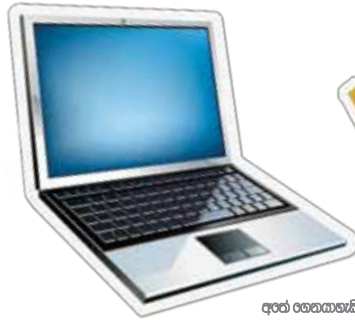
අංග භෞතයැති ඒකසක (Laptops)