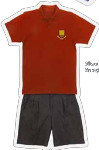
බිම්භන සෘතුබදී බිල ඇඳුම්