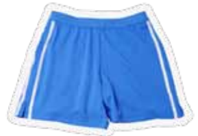
භීතා බිල ඇඳුම්