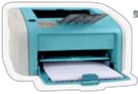
මුද්‍රණ යන්ත්‍ර (Printers)

2011 ජූලි 1 වෙනි දින සිට මිලදී ගන්නා පාසැල් නිල ඇඳුම්ද දැන් ඇතුළත් වේ