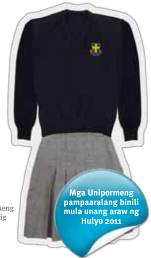
Mga Unipormeng pampaaralang binili mula unang araw ng Hulyo 2011