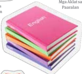
Mga Aklat sa Paaralan