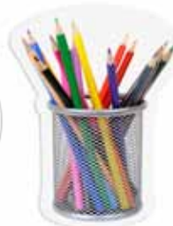
Mga kagamitan sa pagsulat