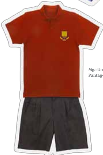
Mga Unipormeng Pantag-init