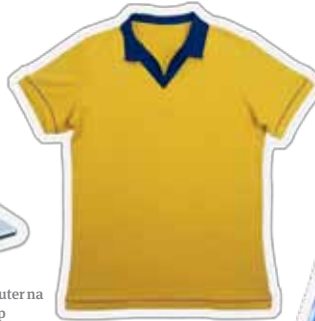
Mga Unipormeng Pang-Isport