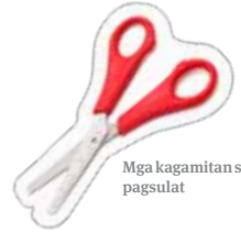
Mga kagamitan sa pagsulat