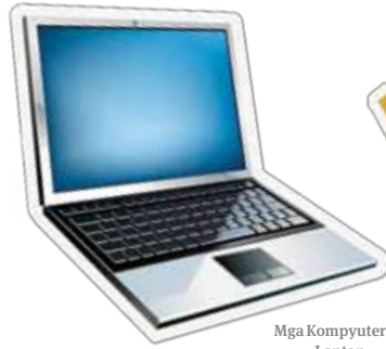
Mga Kompyuter na Laptop