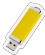
ยูเอสบี แฟลช ไดรฟ์