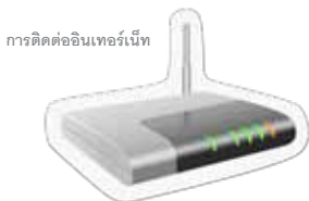
การติดต่ออินเทอร์เน็ต