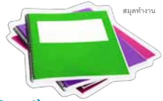
สมุดทำงาน