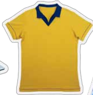
เครื่องแบบกีฬา