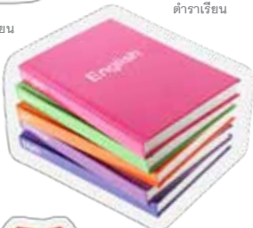
ตำราเรียน