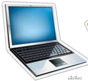
แล็ปท็อป