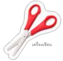
เครื่องเขียน