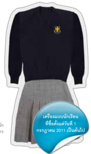
เครื่องแบบนักเรียนที่ซื้อตั้งแต่วันที่ 1 กรกฎาคม 2011 เป็นต้นไป