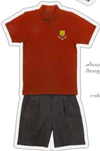
เครื่องแบบนักเรียนฤดูร้อน