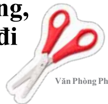
Văn Phòng Phẩm