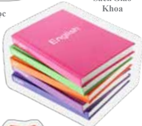
Sách Giáo Khoa