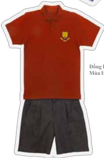
Đồng Phục Mùa Hè