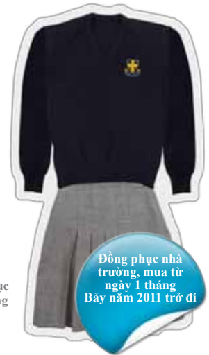
Đồng phục nhà trường, mua từ ngày 1 tháng Bảy năm 2011 trở đi