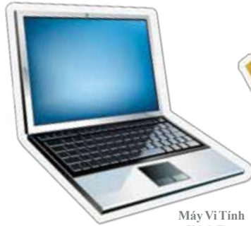
Máy Vi Tính Xách Tay