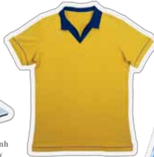
Đồng Phục Thể Thao