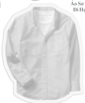
Áo Sơ Mi Đi Học